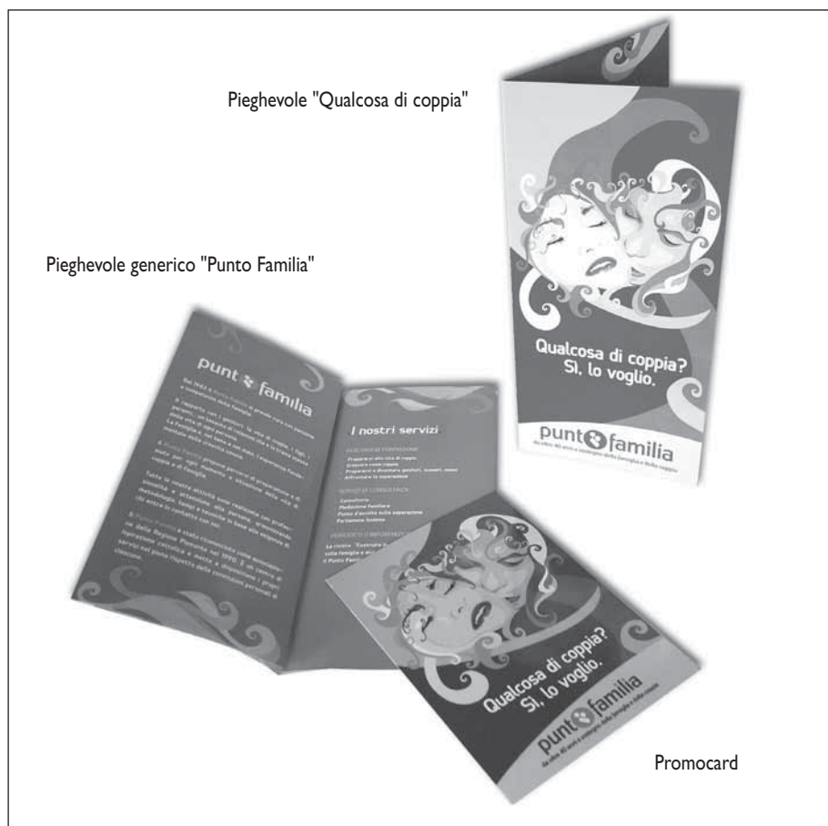
Pieghevole "Qualcosa di coppia"

Viviamo un'epoca che il sociologo Baumann ha definito di "legami fluidi", in cui sembra che nessuna relazione, pubblica o privata che sia, possa resistere allo scorrere del tempo. Amori, amicizie, rapporti di parentela si stringono e si sciolgono in successioni in cui, a volte, è difficile cogliere la continuità. È ormai un luogo comune parlare di "crisi della fami-