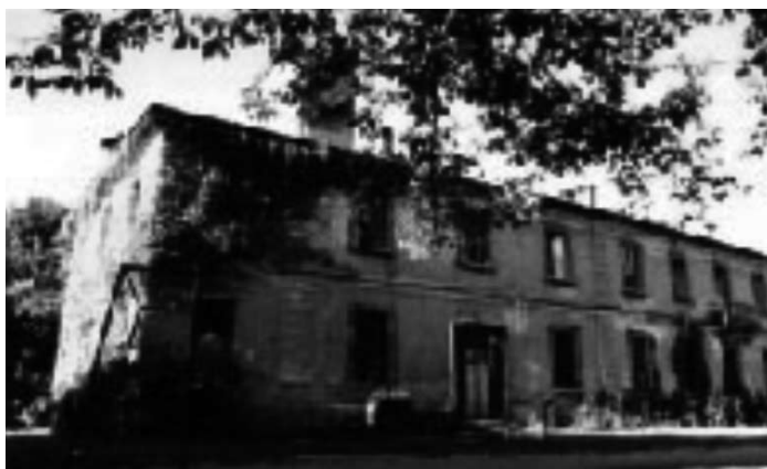
La cascina di Villapizzone.

Motore ed essenza di questa associazione è la convinzione che le persone e le famiglie, valorizzando la loro diversità,